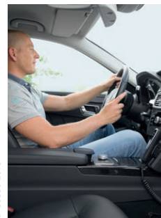
5. Motor starten.