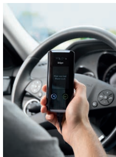
2. Verzoek tot afgifte van de ademtest.