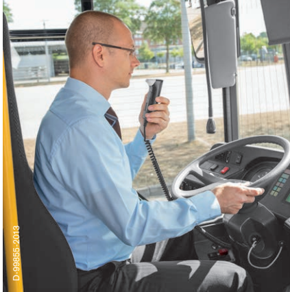
Toepassing in bussen

logie van de Alcotest familie. Alcoholsloten van Dräger zijn al meer dan 20 jaar wereldwijd met succes op de markt.