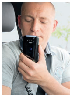
3. Meting van de ademalcoholconcentratie.