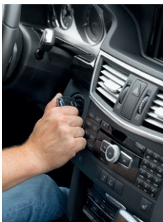
1. Contact inschakelen.