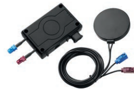
Camera Interlock® 7000