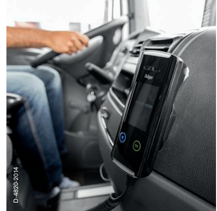
Toepassing in trucks