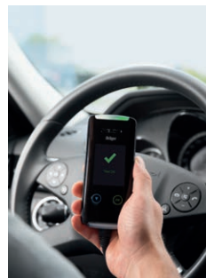
4. Geaccepteerde ademtest: vrijgave van het startcircuit.